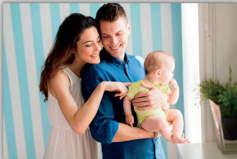
Těhotenství z hlediska věku ženy a bio-psycho-sociálních souvislostí